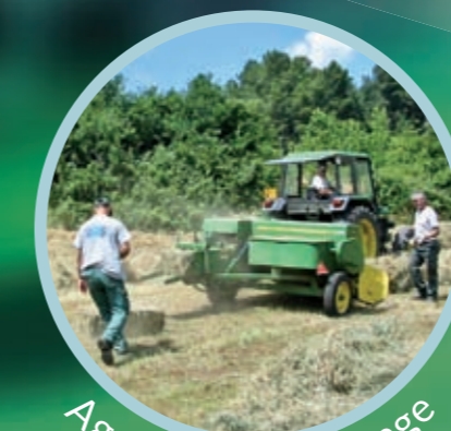
Agriculture / Elevage