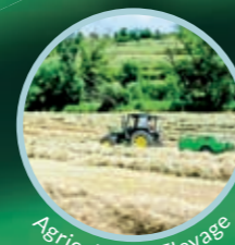
Agriculture / Elevage