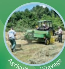
Agriculture / Elevage