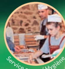
Service repas / Hygiène