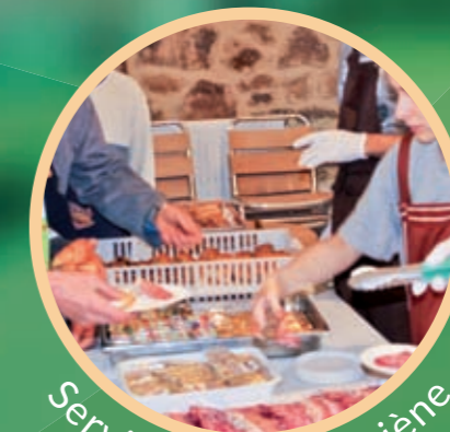
Service repas / Hygiène